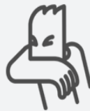
Estornudá en el pliegue del codo