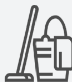
Desinfectá los objetos que usás con frecuencia