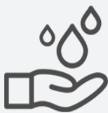
Lavate las manos con jabón regularmente