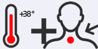
Fiebre y dolor de garganta